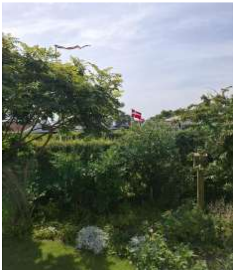
Udsigt dagen for cykelløb i Kerteminde.